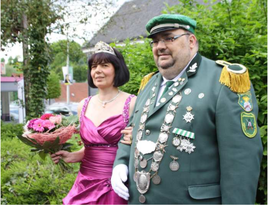
Bundeskönigspaar des Oberbergischen Schützenbundes