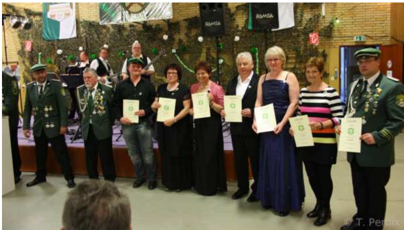
Bild :Ehrungen aus dem Jahr 2013